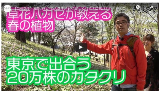
「草花散歩」もオンラインに

※新型コロナウイルス感染症の影響により、2月後半より全イベントを中止・延期中。代わって、人気講座の一部を「オンライン講座」としてYouTube上で公開しています。「草花散歩」「エッセーの書き方講座」をはじめ、体操など、家にいながら学んだり、楽しんだりしていただけるコンテンツを企画しています。動画はYouTubeの「ハルメク公式チャンネル」にアーカイブしています。