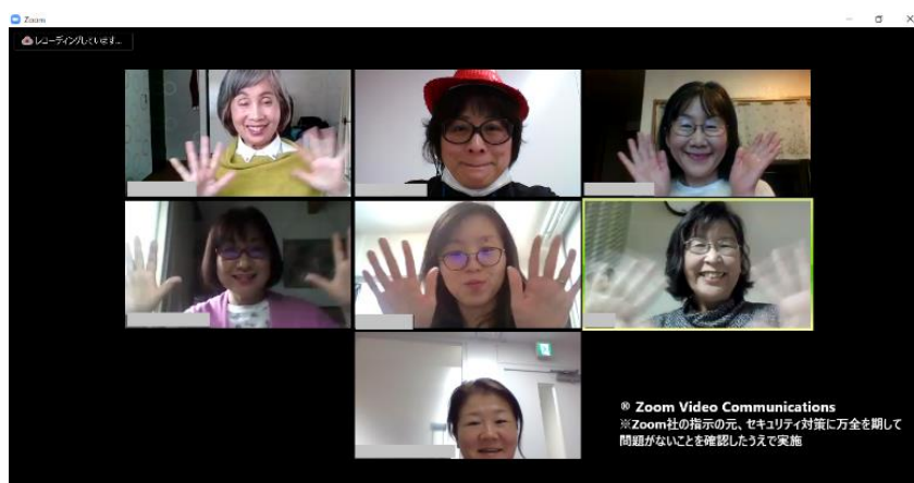
新型コロナウイルス感染症対策のための「オンライン座談会」

※新型コロナウイルス感染症の影響により、現在は対面の座談会を中止し、オンライン会議システムを活用した「オンライン座談会」を開催中。デジタルスキルの低いシニアにも参加していただけるよう、手厚いサポートを行いながら運営しています。