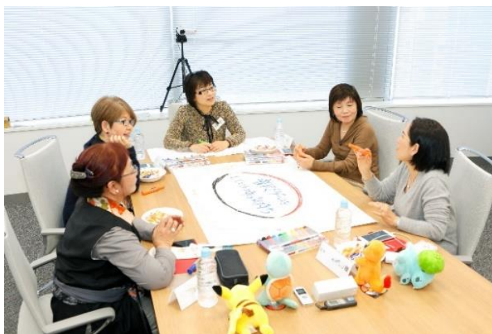
「ハルメク 生きかた上手研究所」によるモニター座談会

リサーチから取材・編集まで一貫して読者の意見を汲み上げながら、一つの雑誌を作るのに約半年という長い時間をかけて、「読者が本当に求めている内容」を誌面に反映していきます。これらの徹底したリサーチを行えるのは、読者との深い信頼関係があるからこそです。