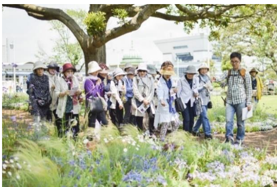
定番人気イベントの「草花散歩」

ハルメクオリジナルのイベントは、企画から運営まですべて自社スタッフで行っており、その開催数は年間約200回に上ります。雑誌「ハルメク」で連載を持つ講師による講座も人気で、テレビでも話題の「きくち体操」の講演会等、参加者が1,000名以上になる大規模なイベントも定期的に開催しています。