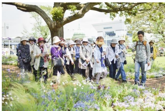
定番人気イベントの「草花散歩」

当社は、雑誌以外の事業にも力を入れています。企画から運営まですべて自社スタッフが行うオリジナルイベントを、年間約200回開催しています。最近話題の「きくち体操」等、雑誌「ハルメク」で人気連載を持つ方を講師に招いた講座も頻繁に開催しています。